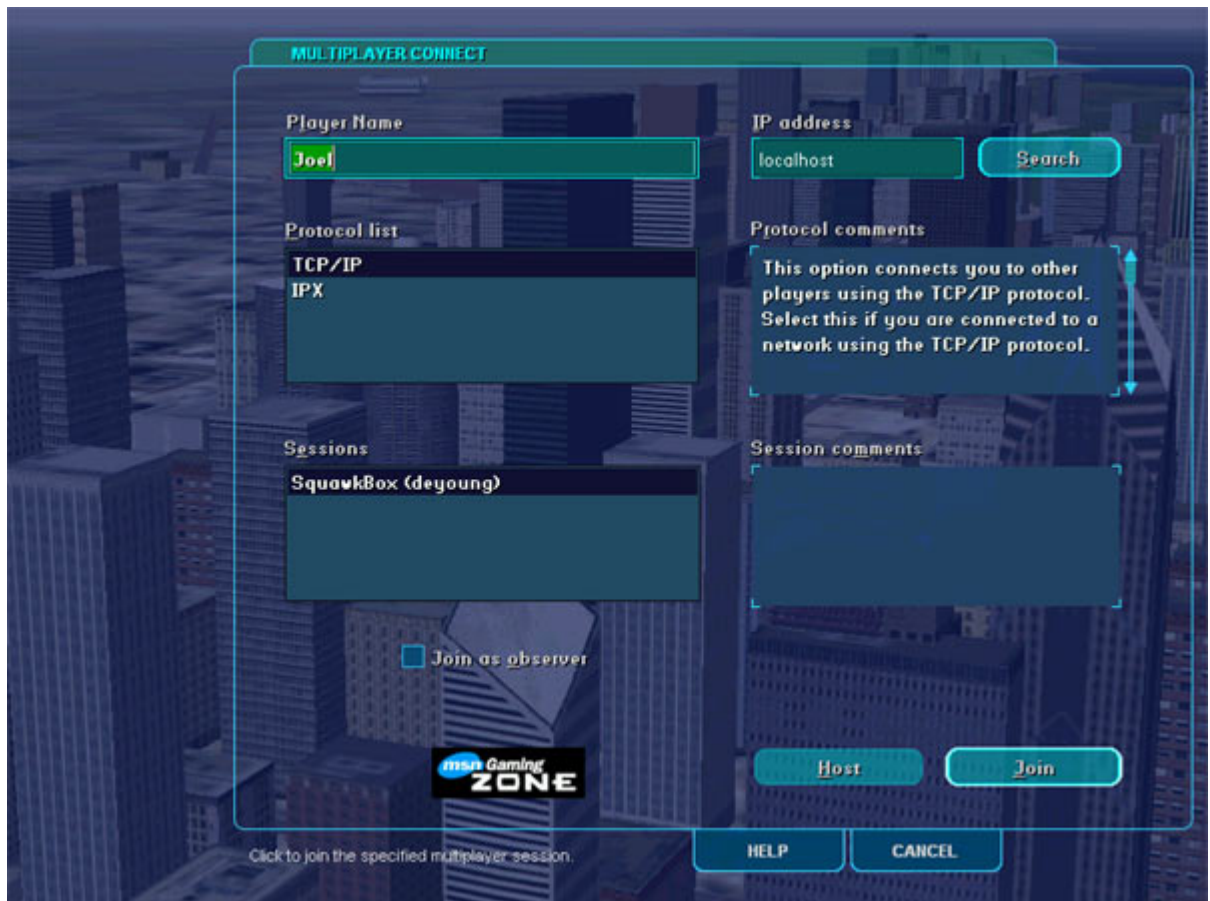
Σύνδεση με το Multiplayer Session

Αν χρησιμοποιείτε το Microsoft Flight Simulator 2002 , τότε επιλέξτε multiplayer και στην συνέχεια Connect .